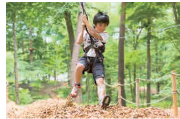
スリルを乗り越えた自信が、笑顔に現れます