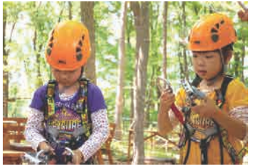
ハーネスを身につけます

浅間高原に広がる原生林「ルオムの森」を舞台にした、フランス発の樹上冒険施設です。ハーネスという命綱を装着し、自分の安全を自分で確保しながら、木立ちにはりめぐらされたコースを進んでいきます。見慣れた森の姿も、鳥の視点で見下ろすとまるで別世界。最高12mの高さから飛び立つ緊張感と爽快感は、日常では味わえない感動をもたらす、自信が身に付きます。また、家族や友人などグループで挑戦することで、連帯感が生まれお互いの信頼関係が深まります。リスクマネジメントやチームビルディングなどの研修・教育ツールとしても高く評価される「スウィートグラス・アドベンチャー」。この機会に、ぜひ体験してください。