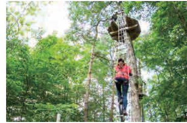
ゆれる縄ばしごを伝って、いざ樹上へ