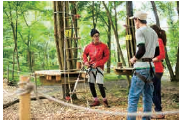
安全講習で「自分の安全は自分で守る」ことを学びます