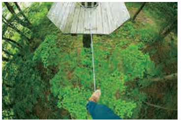
見たこともない世界が、眼下に広がります